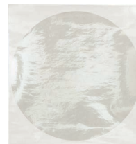
傷防止透明シール (付属品と同等)