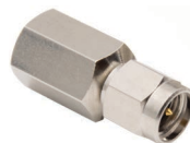
SMA-P コネクタ (付属品と同等)